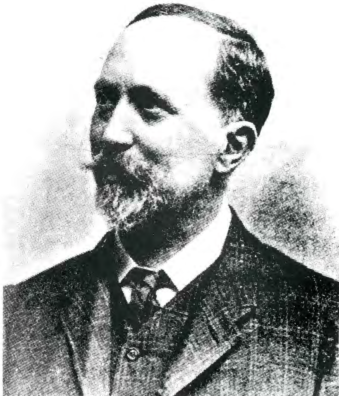
Josep Pella i Forgas.

s'integren dins del caliu cultural que sorgí amb el naixent catalanisme.